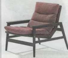
Composizione a vista Jean-Marie Massaud aggiunge un elemento alla collezione Ipanema per Poliform, con questa poltrona per Poliform, con questa poltrona dalla struttura in legno a vista