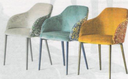
Cartografie Milano, Roma e Napoli. Questi i nuovi pattern di Sofia, la sedia di Riflessi

Una cura particolare è stata messa anche nella scelta e composizione dei colori. Colori che rievocano le cromie che sono il "marchio" di ciascuna città e che vengono fatti penetrare in profondità nel filato tramite un delicato processo che garantisce la resistenza e l'alta qualità dell'immagine sul tessuto. Le stampe vivide che ne risultano sono abbinate a un rivestimento monocromatico in velluto Amalfi per la parte interna della seduta, e a differenti finiture per la base metallica: grafite per la versione Milano, cobalto per Napoli, ottone per Roma.