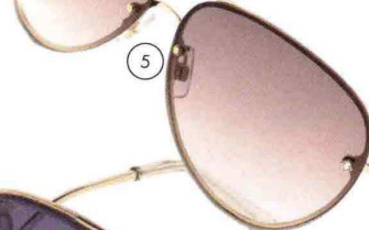
5. Bijoux, con cristalli decoro, Swarovski Eyewear (180 euro).