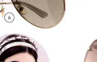
6. A goocia, con montatura di metallo, Calvin Klein by Marchon (235 euro).