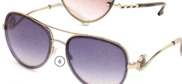
6. Bluette, con doppio ponte e astine gioiello, Roberto Cavalli Eyewear by Marcolin (240 euro).