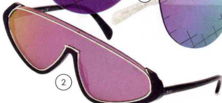
2. Futuristici, con montatura design, Emilio Pucci Eyewear (500 euro).