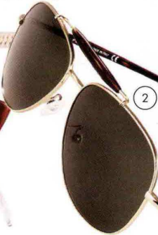
2. Bosco, di metallo dorato con dettagli tartarugati, Fedon (159 euro).