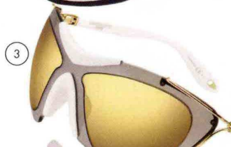
3. Spaziali, con lenti dorate, Givenchy by Riccardo Tisci (450 euro).