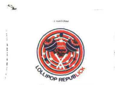
CHUPA CHUPS LE PANDORINE (€ 49).