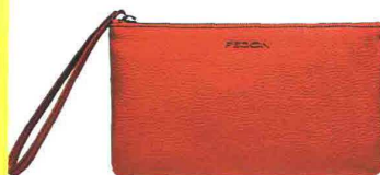
COLOR GERANIO FEDON (€ 59).