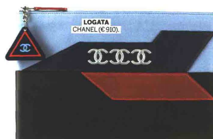
LOGATA CHANEL (€ 910).