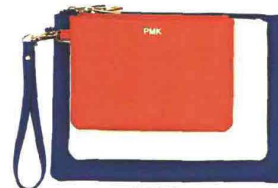
TRE IN UNA POMIKAKI (€ 68).