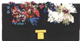
CON PERLINE VENEZIANI (€ 1.900).