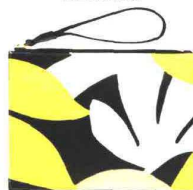
FIORI ASTRATTI MARNI (€ 390).