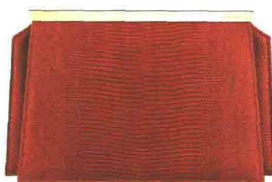
LIZARD CORALLO GIORGIO ARMANI (€ 2.500).