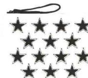
STELLE GLITTER OVS (€ 19,99).