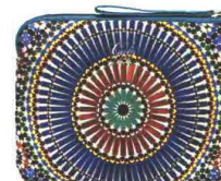
STAMPA DIGITALE GABS (€ 49).