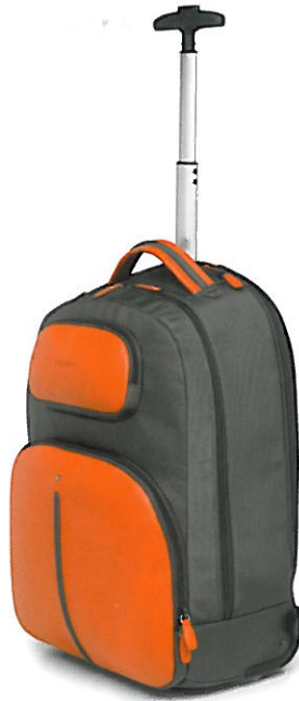
Fedon Travel Web Backpack & Trolley

Ci è rimasta particolarmente impressa la “messenger bag” Carpe Diem Tam-Tam, borsa a tracolla proposta dalla tedesca PA Accessoires: a renderla intrigante è l’aspetto sgualcito, ottenuto mediante il trattamento in centrifuga del prodotto finito. Di concezione innovativa anche “Travel Web Backpack & Trolley” e “Marco Polo” di Fedon, prodotti che adottano soluzioni diverse per raggiungere il fine comune del comfort dei viaggiatori contemporanei. Il primo è uno zaino convertibile in trolley con un rapido clic, mentre il secondo è un bagaglio a mano in grado di contenere il guardaroba necessario per cinque notti, concepito sulla base delle risposte di 2.000 viaggiatori intervistati.