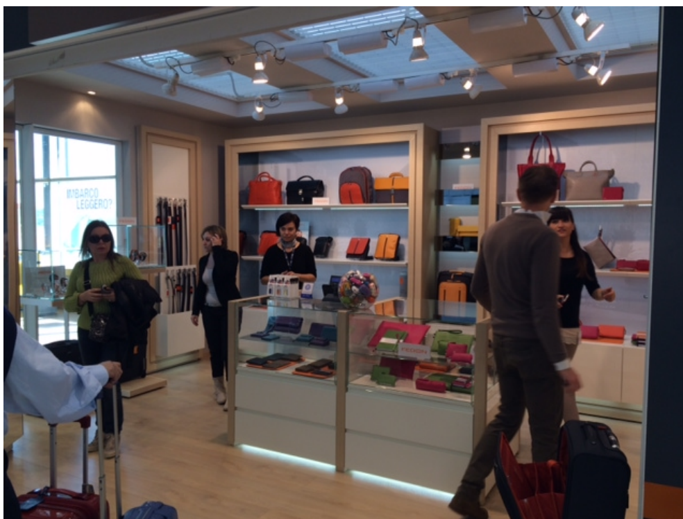
Negozi Fedon 1919 a Milano Malpensa

comunicazione) volti a far crescere le vendite del marchio, ma i ricavi si manifesteranno solo nel biennio successivo.