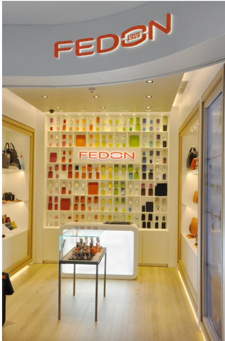
Negozi Fedon 1919 a Hong Kong IFC Mall