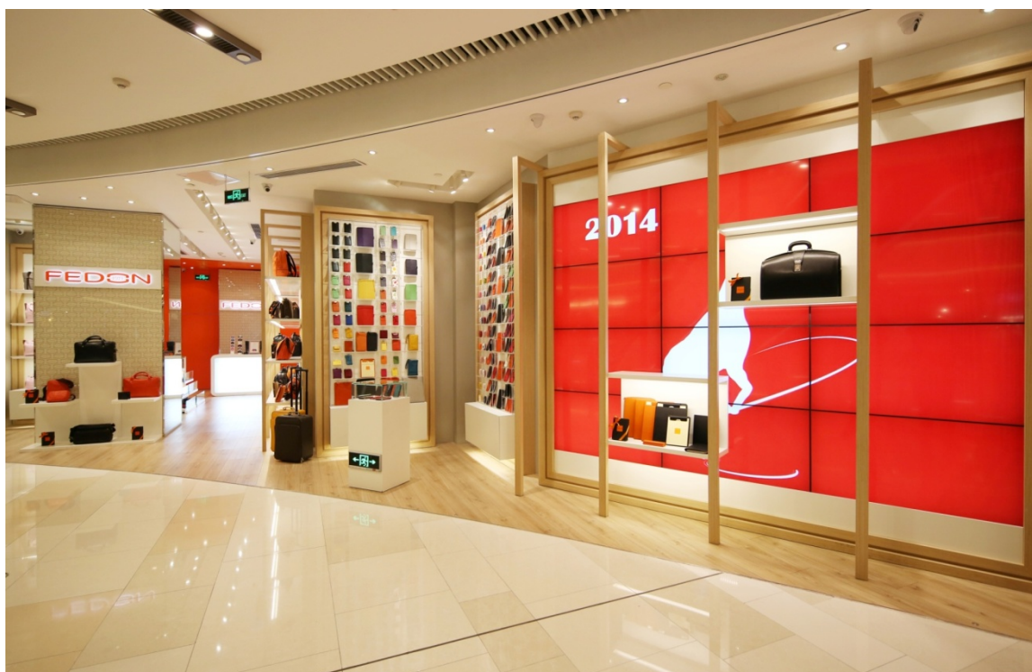
Negozio Fedon 1919 a Shanghai Apm Mall

La tabella che segue evidenzia la composizione della Posizione finanziaria netta al termine di ogni periodo: