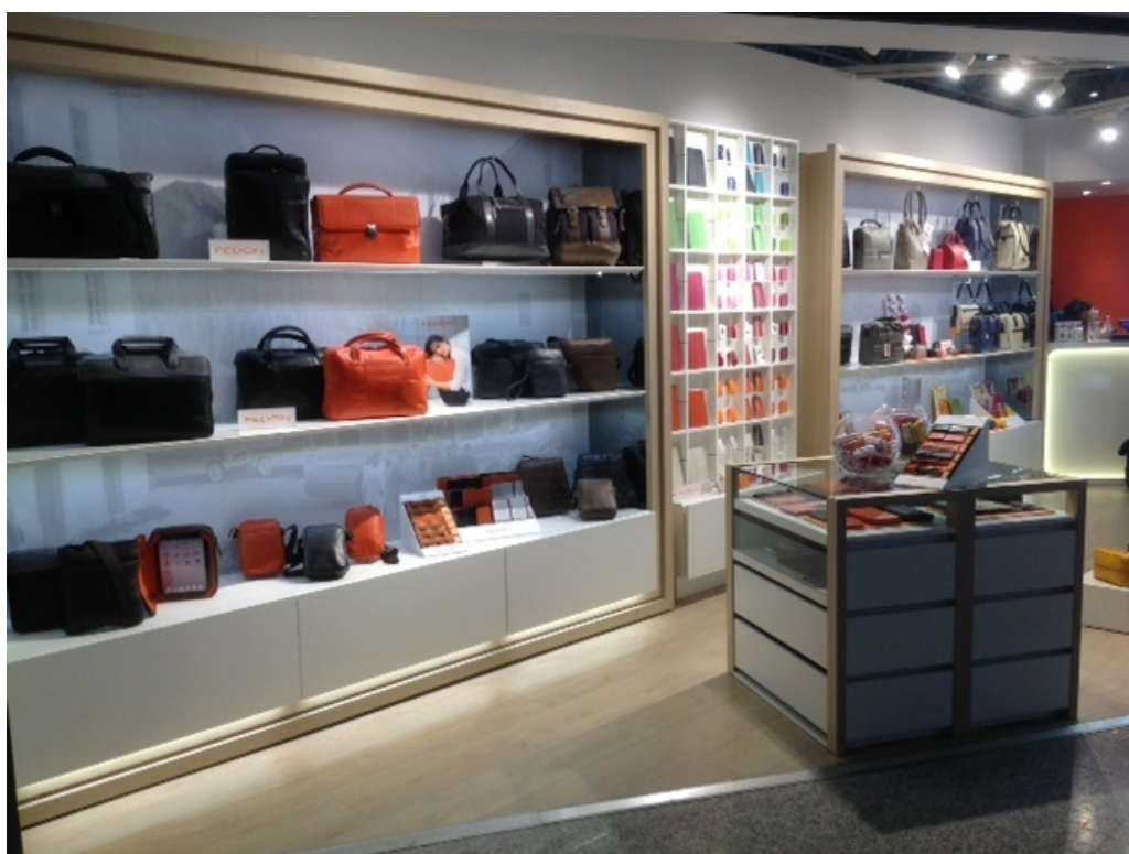
Negozi Fedon 1919 a Roma Fiumicino

Il Gruppo ha tre stabilimenti produttivi, rispettivamente in Italia, in Romania e in Cina e quattro filiali commerciali in Usa, Hong Kong, Germania e Francia.