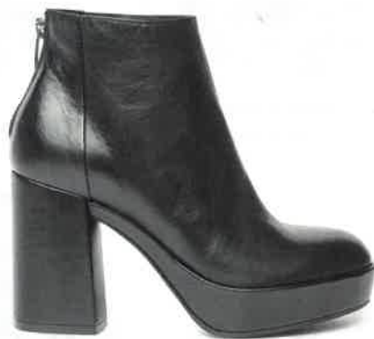
TRONCHETTI in pelle con plateau, Janet & Janet (209 euro).