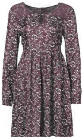
MINIDRESS in viscosa, C&A Collezione Yessica (25 euro).