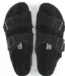
CIABATTE in suède e pelliccia, Birkenstock (120 euro).