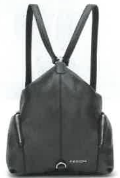
BACKPACK in pelle, Fedon (199 euro).