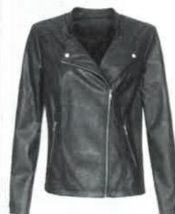
GIACCA in ecopelle, Fiorella Rubino (99 euro).