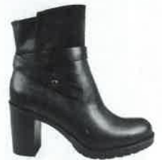
BOOTS in pelle e suède, Igi&Co (114,90 euro).