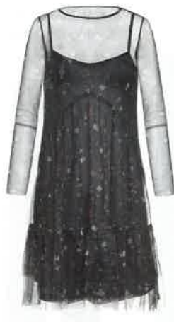
ABITO in tulle, Ovs (24,99 euro).