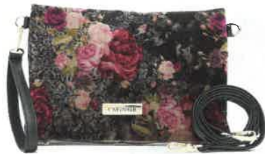
TRACOLLA in tessuto floreale, CaféNoir (59 euro).