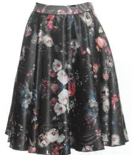
GONNA a ruota in satin, Fracomina (99,90 euro).

Dalla musica fino alle passerelle, il nuovo streetstyle è strong e deciso. Un mix&match tra giacche in pelle borchiate, ankle boots grintosi e microstampe floreali in versione dark.