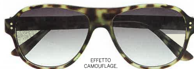
EFFETTO CAMOUFLAGE, CAFENOIR (€119).