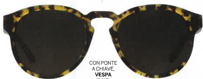
CON PONTE A CHIAVE, VESPA (€115).