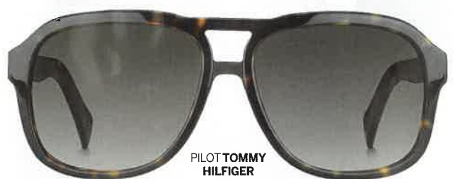
PILOT TOMMY HILFGER EYEWEAR BY SAFILO (€139).