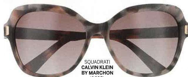
SQUADRATI CALVIN KLEIN BY MARCHON (€295).