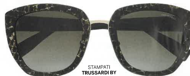
STAMPATI TRUSSARDI BY DE RIGO VISION (€179).