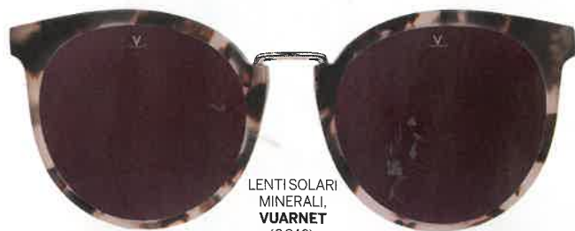
LENTI SOLARI MINERALI, VUARNET (€240).