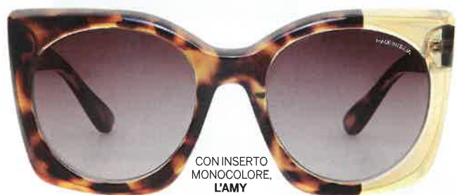
CON INSERTO MONOCOLORE, LAMY (€59).