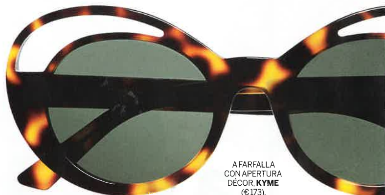
A FARFALLA CON APERTURA DÉCOR, KYME (€173).