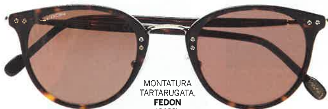
MONTATURA TARTARUGATA, FEDON (€189).