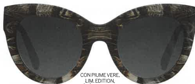
CON PIUME VERE. LIM. EDITION, ÉTÉ LUNETTES (€190).